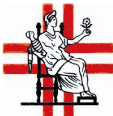
Collegio Provinciale delle Ostetriche di Roma