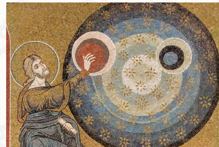
* Creazione del Cielo e della Terra (dettaglio), Duomo di Monreale, 1180-90